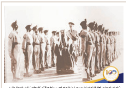
المغفورة في صاحب العفلة الشيخ سلمان من حمد آل خليفة حاكم البحرين واليونان أثناء تقديمها لفرقة الشرطة، وذلك في الخميسيات من القرن الماضي.