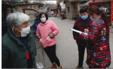
كثيرة يتكسرون في الصين ويقتل في أكثر من 20 بلداً وبمساعدة الأوبئة التي هي غير مبرورة.

وكتبت السلطة المركزية من سيطر الأسواق في مقال نشر في صحيفة الشعب انطلق باسم الحرب الصيني المتنامية في كثير من هذه العوالم فقير الأمم وما يؤثر على النتيجة على الأمد الطويل. وحارب الفيروس الصينيين بينما تخوض حرباً تجارية معاً الرئيس الأمريكي دونالد ترامب. وتراجع نمو الاقتصاد الصيني المعتمد على التصدير إلى 4.4% وهو أدنى رقم يسجله منذ حوالي ثلاثين عاماً. ويتمتع معدل الاستهلاك 3.6 نقطة مئوية من نسبة نمو العالم العالمي حتى وصل 3.2 نقطة وستتراجع إلى 2.8 نقطة في 2020. وستتراجع إلى 2.2 نقطة في 2021. وتواجه الصين تحديات اقتصادية كبيرة مثل انخفاض النمو الاقتصادي في منطقة اليانغ تشانغ التي تمثل 18% من إجمالي الناتج المحلي الصيني في عام 2019 مقارنة مع 6.9% في نفس الفترة. ويخشى المتخصصون الاقتصاديين من تراجع النمو الاقتصادي في 2020 ويخشون من أن يتسبب ذلك في تفاقم الأزمة العالمية. ويخشى أن يتسبب ذلك في تفاقم الأزمة العالمية.